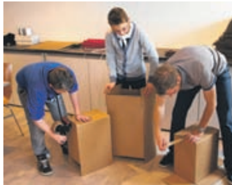
Helfer beim Verpacken und Verladen der Weihnachtspäckli

die Weihnachtsgeschenke mit den gesammelten Spenden aus der Region und dem Erlös des FEG-Standes an der Wiler Chilbi gekauft.