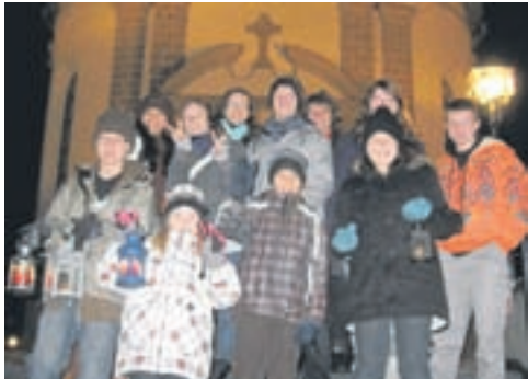
Abholen des Friedenslichts 2012