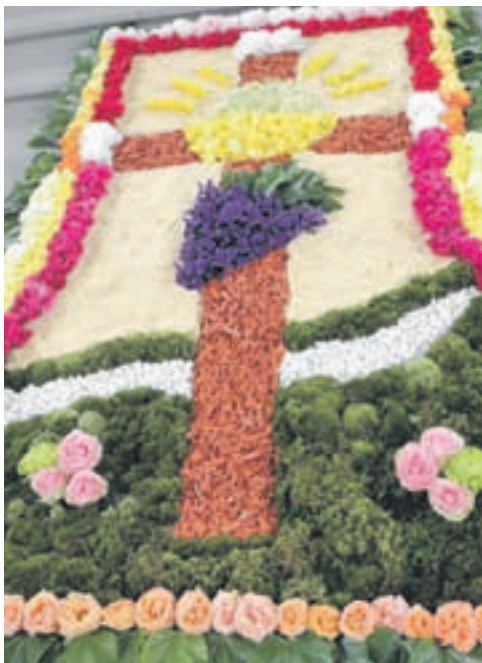
Blumenteppeich in Wollerau 2012

Auch in diesem Jahr wird eine Gruppe von Freiwilligen am Mittwoch, 29. Mai , wieder einen Fronleichnamstblattenteppich gestalten, an dem wir uns dann in der Pfarrkirche erfreuen dürfen!