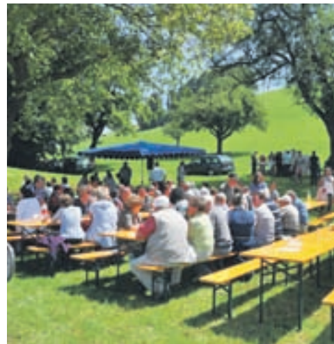
Fronleichnamprozession in die Baumen

Fronleichnamprozession zur Baumen Eucharistiefeyer mit den Erstkommunikanten; bei schlechter Witterung Eucharistiefeyer in der Pfarrkirche Schindellegi