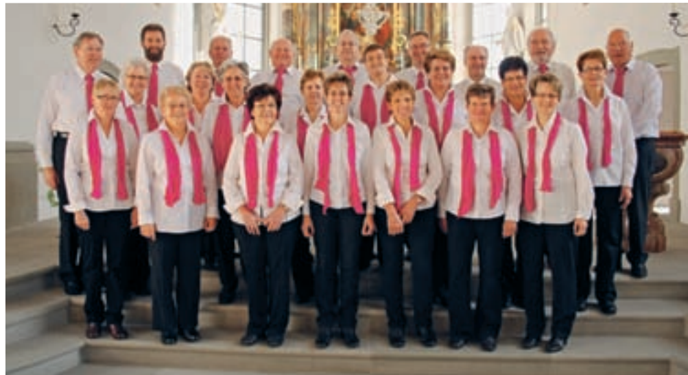
Der Kirchenchor feiert sein 100-Jahr-Jubiläum