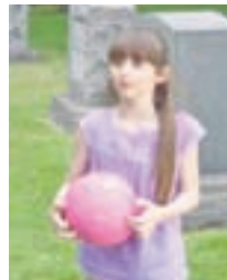
DVD «Da unten»