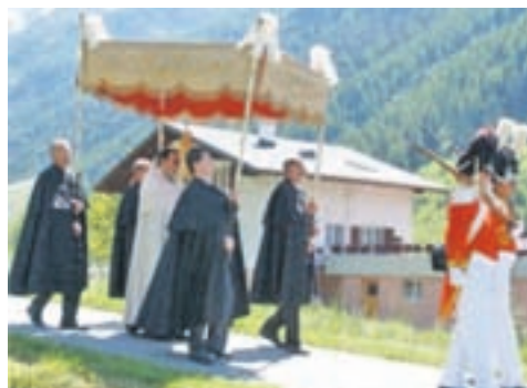
Prozession in Visp.