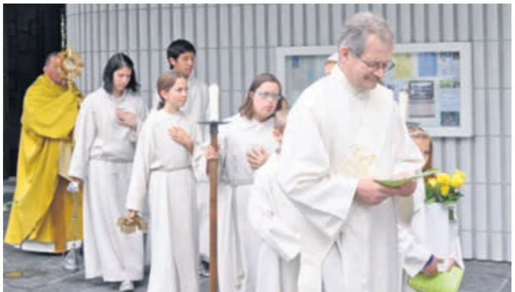
Prozession in Pfäffikon.