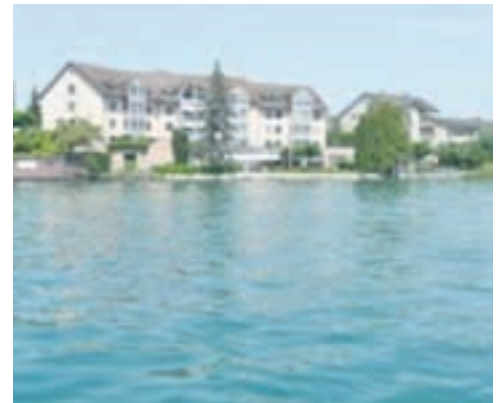
Hospiz in Hurden

Den Rest des Vormittags verbrachten die Schülerinnen und Schüler damit, sich auf kreative Art und Weise mit dem Tod zu befassen.