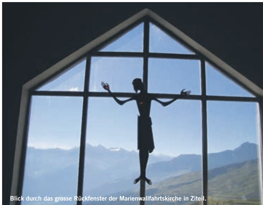
Blick durch das grosse Rückfenster der Marienwallfahrtskirche in Ziteil.