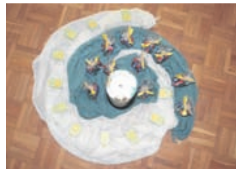
«Sorgedruckli» und Schoggi zum Abschied