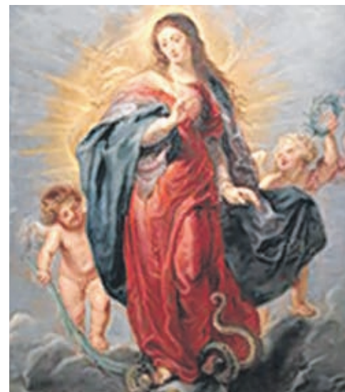
«Maria Immaculata» von Paul Rubens