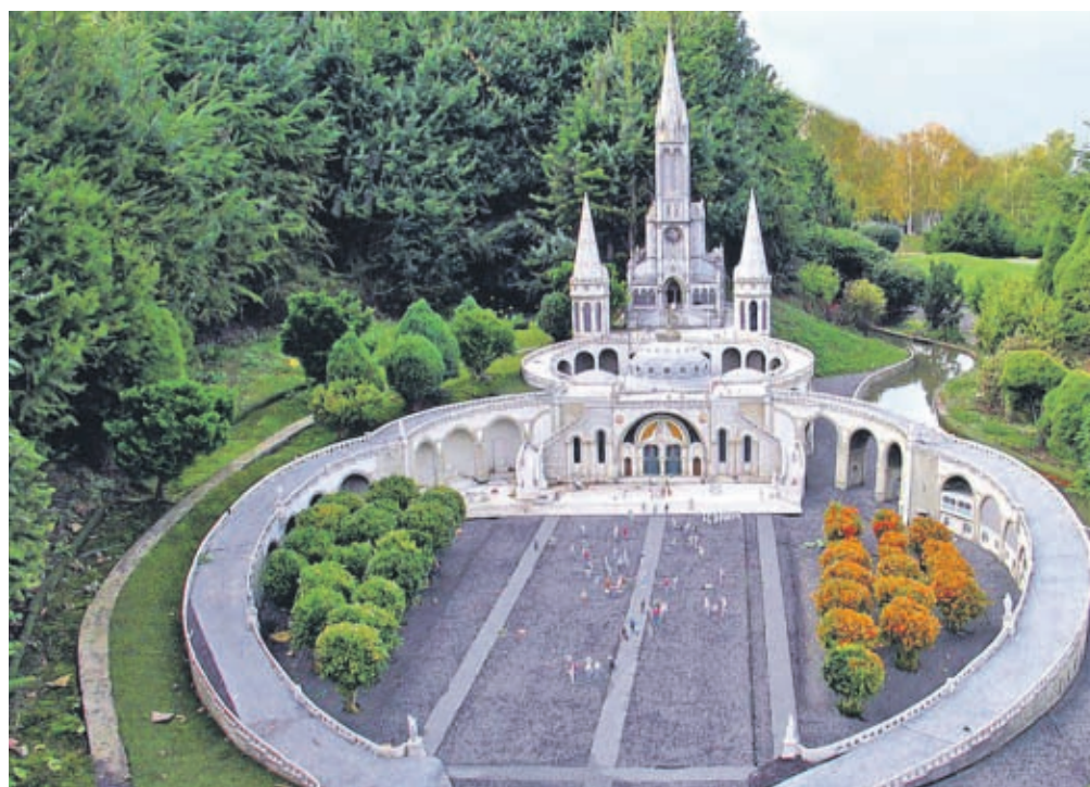
Der «Heilige Bezirk» von Lourdes mit Kirchen.

Zweieinhalb Tage bleiben wir in Lourdes. Wir besuchen den «Heiligen Bezirk» von Lourdes, die Grotte, den Ort der Erscheinungen, einst ein wilder und rauer Felsen, der am Ufer des Gave emporsteigt. Eng mit dem Heiligtum der Grotte ist die Krypta verbunden. Über der Krypta steht die «Obere Basilika». Sie wurde 1874 eingeweiht.