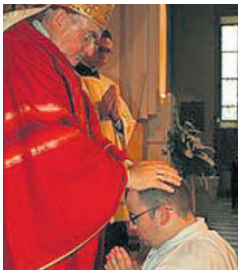
Weihe eines Diakons

In der katholischen Kirche ist die Weihe zum Diakon die erste Stufe des Weihesakraments, die zweite ist das Priester-, die dritte