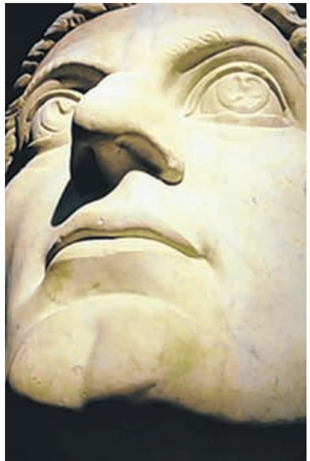
Kaiser Konstantin I.