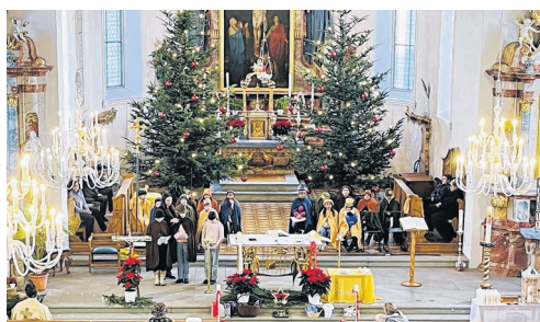
Die Sternsinger wurden im Gottesdienst in der Pfarrkirche Freienbach feierlich ausgesendet.