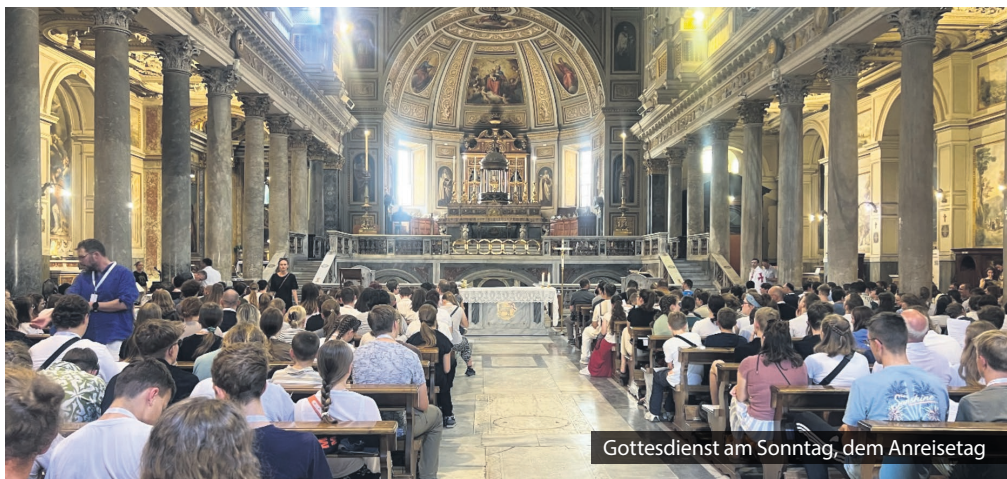
Gottesdienst am Sonntag, dem Anreisetag