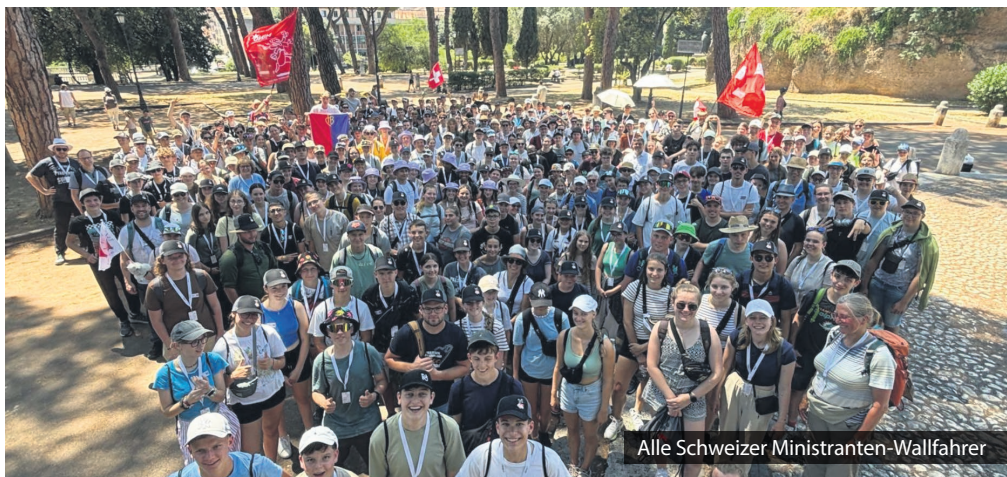
Alle Schweizer Ministranten-Wallfahrer