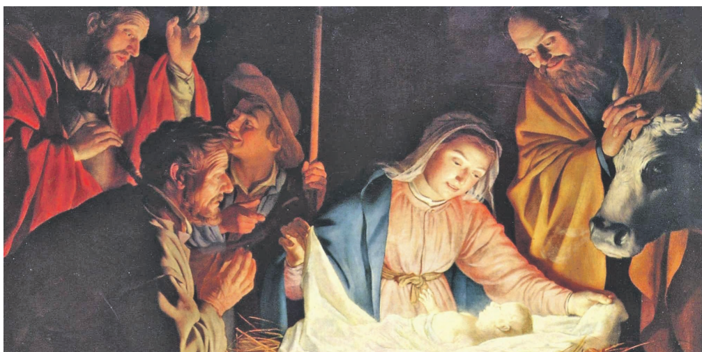
Gerard van Honthorst (1592–1656) – Anbetung der Hirten

Der Familiengottesdienst an Heiligabend lädt ein, die Weihnachtsgeschichte zu hören und wirken zu lassen. Bei bekannten Melodien lädt die Feier Jung und Alt ein, die damaligen Ereignisse neu zu erleben.