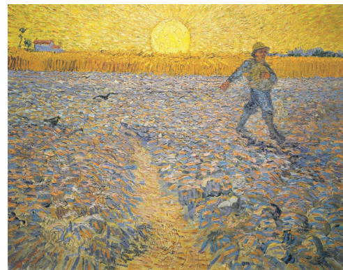
Sämann bei untergehender Sonne (Sower at Sunset), Vincent Van Gogh, 1888.