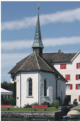
Eucharistiefeier am Donnerstag, 27. Februar, um 19:30 Uhr in der Kapelle Hurden