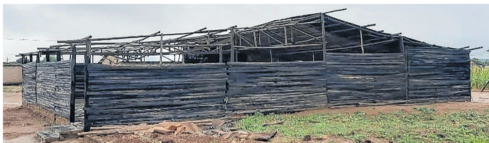
Bestehendes Kirchengebäude der Gemeinde von Namitwa.