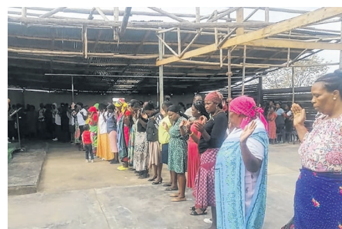
Gottesdienste in der Gemeinde von Namitwa.