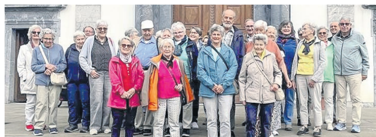
Teilnehmer vor dem Kloster Engelberg.