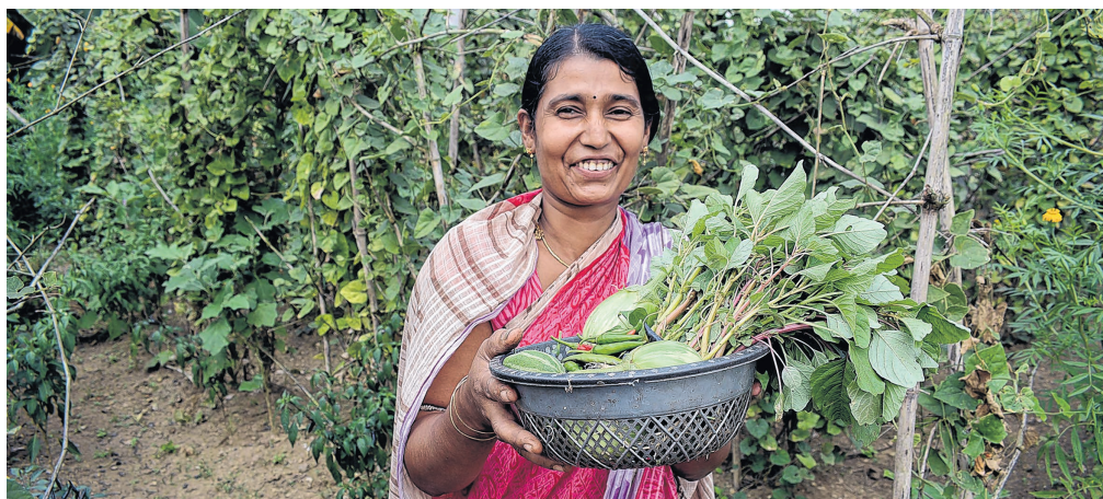
Eine Kleinbäuerin aus dem Distrikt Puri präsentiert stolz ihr biologisch angepflanztes Gemüse.

Urs Zihlmann, Priesterlicher Mitarbeiter