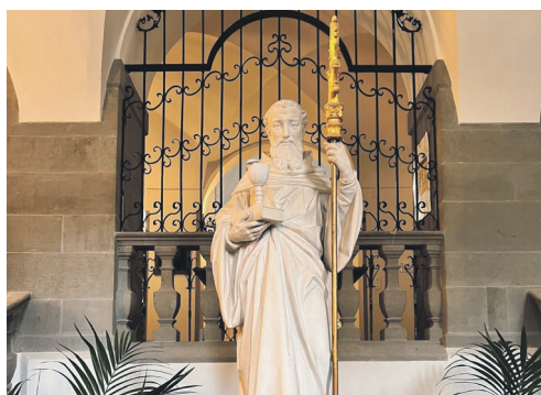
Der hl. Benedikt empfiehlt in seiner Mönchsregel einen Wechsel von Gebet, Arbeit und Lesung.

erst möglich, wenn man nicht viele Nebengeräusche hat. Damit man in einer Haltung des Hörens überhaupt betend verweilen kann, gibt es in der alltäglichen Gebetspraxis verschiedene Hilfen, damit auch eine entsprechende Atmosphäre für das Gebet vorhanden ist: das Entzünden einer Kerze, die Körperhaltung, das Schliessen der Augen oder auch das Entzünden von Weihrauch.