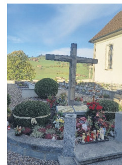
Gemeinschaftsgrab in Schüpfheim (links) und in Entlebuch.